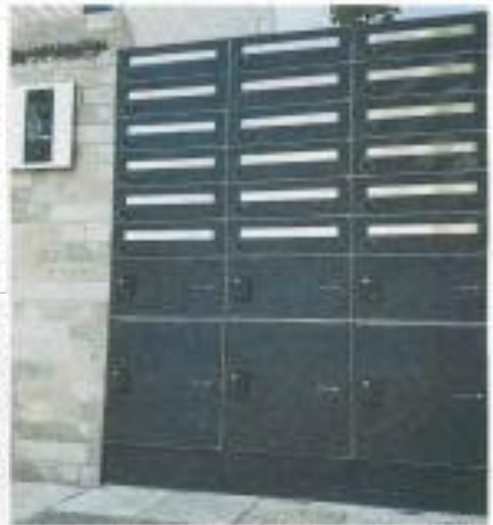
▲併設館を希望する入居者から人気の宅配ボックス（調査 提供：ユニゾン）